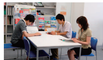
必要な資料を自由に閲覧できます。 利用時間は月～金10:15～17:15です。