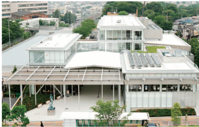
大岡山キャリアアドバイザールーム、就職資料室は東工大蔵前会館3階にあります。